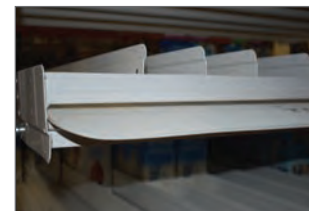
Aparece con nuestras láminas deslizantes patentadas y bandeja de goteo.